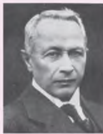
Prof. Hugo Junkers

Johann Wolfgang von Goethe weilte in Begleitung seines Dienstherrn Carl August von Sachsen-Weimar-Eisenach sieben Mal im Gartenreich des Fürsten Franz von Anhalt-Dessau. Die englischen Gärten und modernen Bauten in Anhalt-Dessau begeisterten den Dichterrfürsten stets auf Neue und inspirierten ihn zu eigenen Produktionen. So entstanden Zeichnungen Goethes vom Gartenreich oder fanden Personen und die aufgeklärte Atmosphäre am Dessauer Hof Eingang in seine Werke. Ausdruck der Bewunderung für das Gartenreich ist unter anderem sein Brief von 1778 aus Wörlitz an Charlotte von Stein, in dem er schrieb „Hier ist´s jetzt unendlich schön. Mich hat´s gestern Abend sehr gerührt...wie die Götter dem Fürsten erlaubt haben, einen Traum um sich herum zu schaffen.“